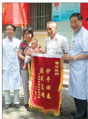
洛龙区东坡村民陆自来全家护理人员(图3)

刘益斌拜访了参加对他的科研成果进行鉴定并给予指导的「中医泰斗」「国医大师」、九十八岁高龄的路志正(右)老先生(图1)