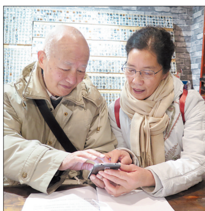
别看他年纪大,学起微信挺认真

若您没跟上第一期微信教学不要紧,第二期微信培训班将于3月开班,请您关注《幸福周刊》刊发的报名信息。