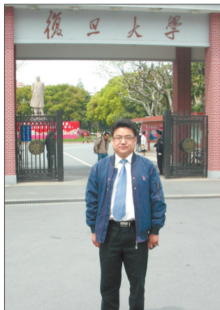
任红军游览复旦大学