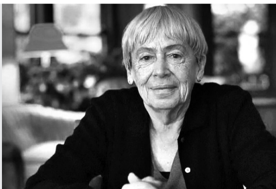
厄休拉·勒古恩 (资料图片)