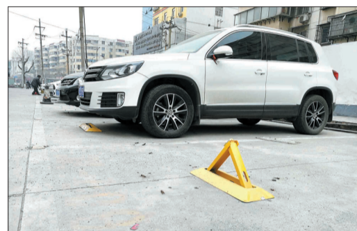
部分停车位被安装了地锁