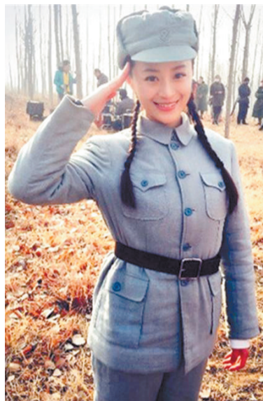
《我的父亲我的兵》剧照