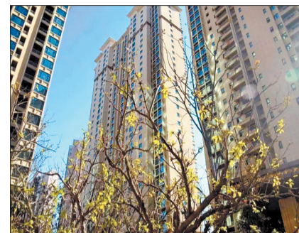
水岸国际实景(资料图片)

今天是正月十四,您若有空,不妨到九都路与定鼎路交会处东200米的水岸国际欣赏舞狮等表演吧。