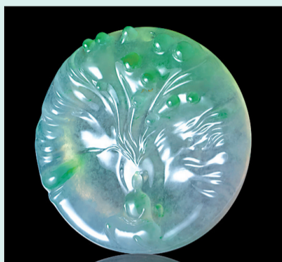
本文图片均为“万象”系列作品