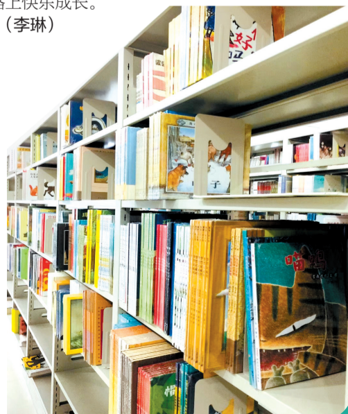
阅享号书库一角 (本文图片均为资料图片)