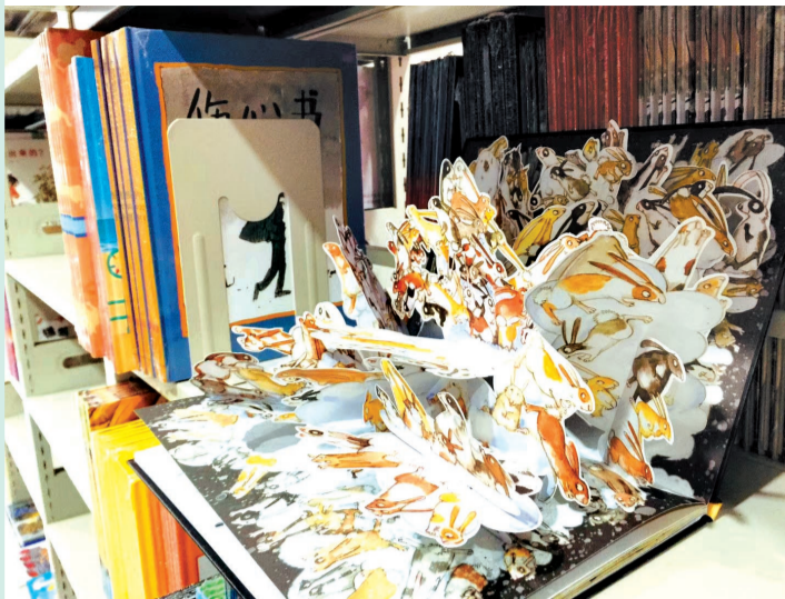
阅享号书库中有大量的立体书

阅享号作为咱洛阳人身边的少儿导读平台,由洛阳日报报业集团与北京九喜科技有限公司联合主办,它以优质的少儿图书、省钱的借阅方式、专业的配送服务等优势,让洛阳少儿足不出户读好书。今天,阅享号就从5个方面,说一说如何让你的孩子也能一年读300本书。