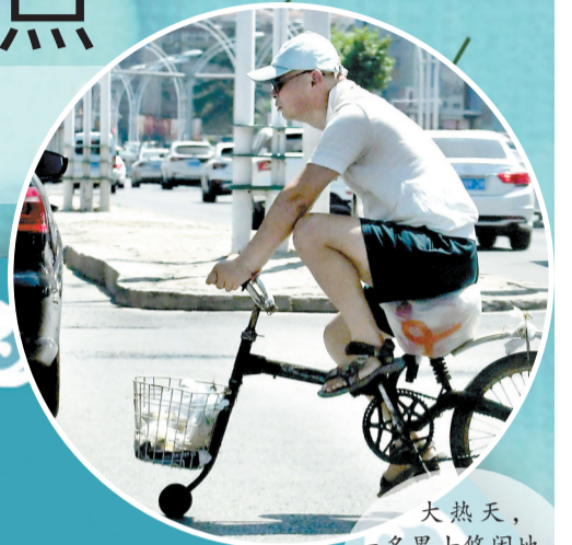
大热天,一名男士悠闲地骑着一辆前轮小后轮大的自行车,吸引了不少人的目光