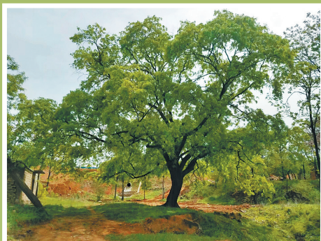
玉川古寨旧址上的皂角树