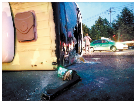
公交车风挡玻璃上有个大洞

当日20时30分,记者在洛阳东方医院见到了4名受伤乘客。经医生诊断,4名乘客有不同程度的外伤,需入院观察治疗。医生说,公交车司机也有轻微擦伤,庆幸的是,5名伤者均无生命危险。