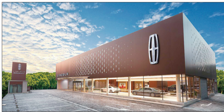
洛阳奥吉通林肯中心

洛阳奥吉通林肯中心是洛阳市林肯厂家授权的正规4S店，严格按照林肯品牌全球统一标准精心打造，设施豪华舒适，设备先进完善。秉承林肯的全新个性化用户体验模式“林肯之道”，为每一位客户提供尊贵的服务。洛阳奥吉通林肯中心，以您至上，让豪华回归本源。