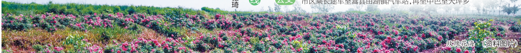
玫瑰花海 (资料图片)