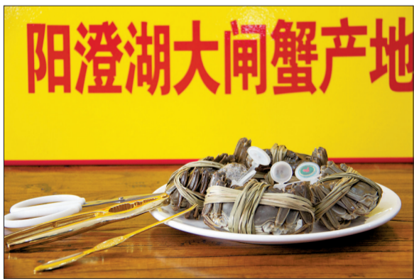
产品展示 (资料图片)