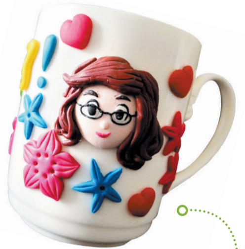
▲《老师,谢谢您》(软陶手工) 刘博轩(十一岁) 龙盛小学 指导老师:白明娟