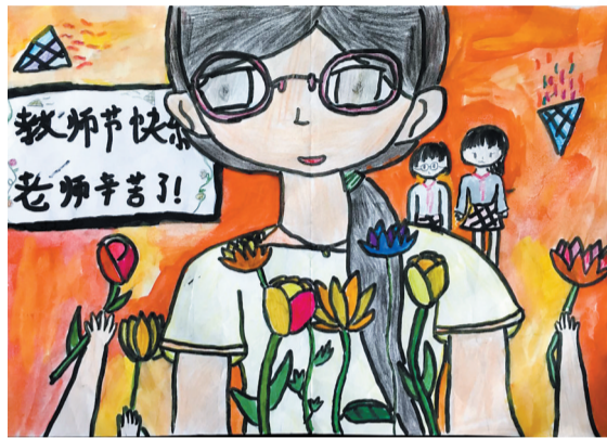
▲《感恩老师》(彩铅水粉画) 伊宇姝(十岁) 西苑路实验小学 指导老师:百景霞