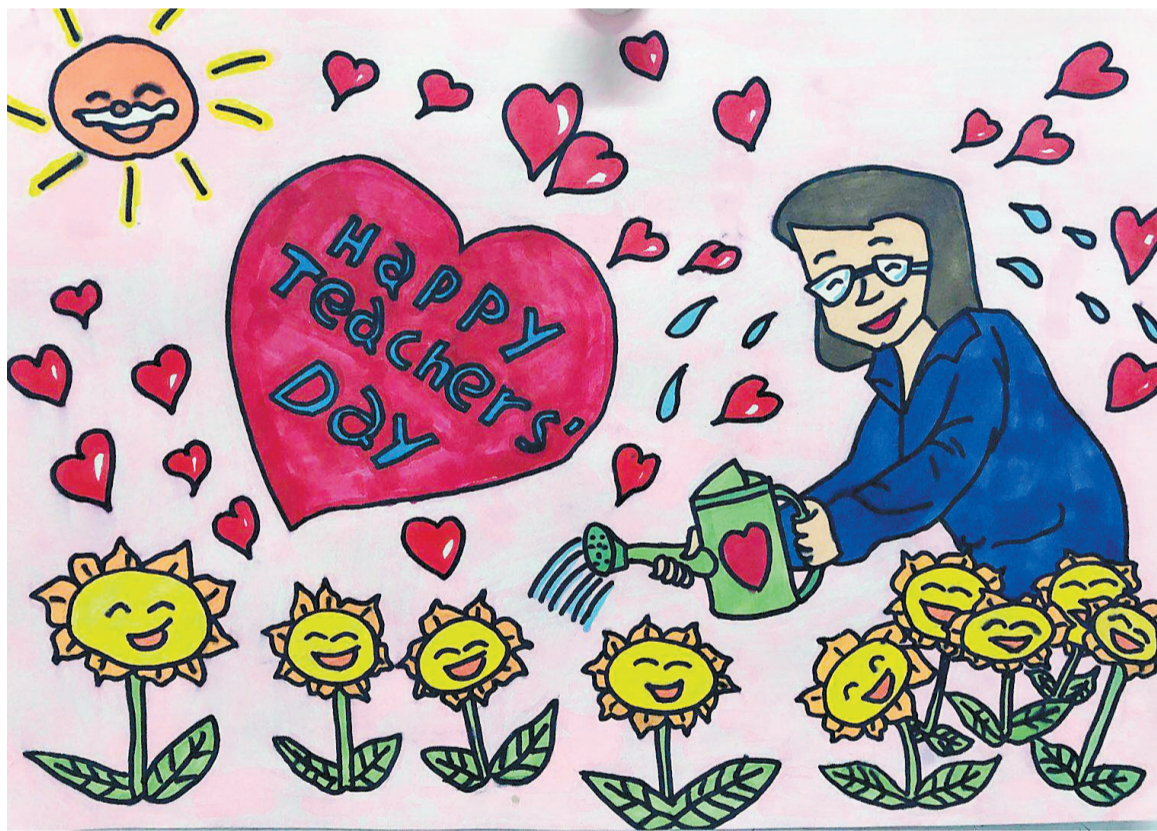
▲《辛勤的园丁》(马克笔画) 常翔(十一岁) 东升一小