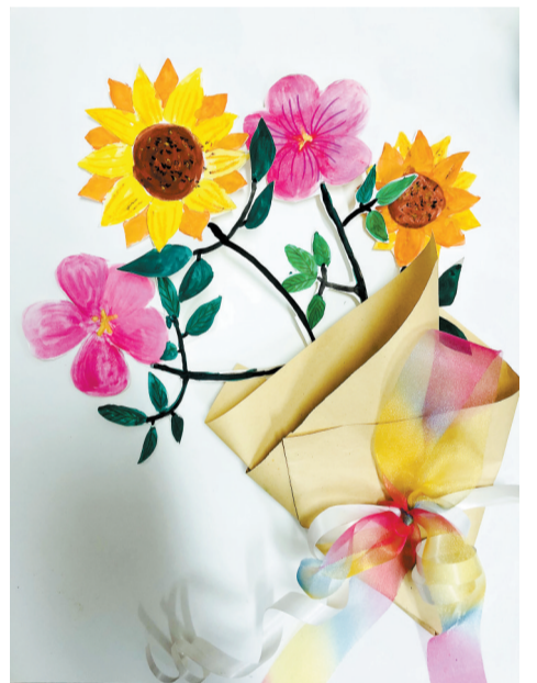
▲《送给老师的花》(卡纸手工) 陈雅琪(九岁) 市实验小学新区分校