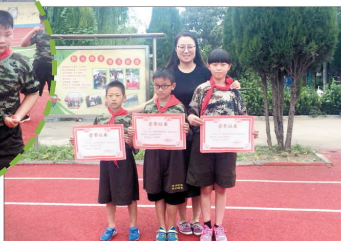
颁奖(老城区土桥小学)