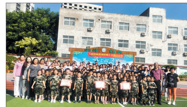
合影留念(西工区大路口小学)