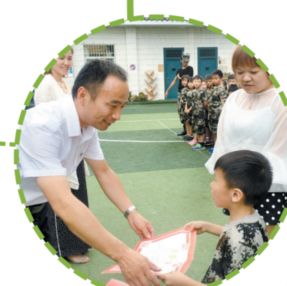
颁奖(西工区第三实验小学)