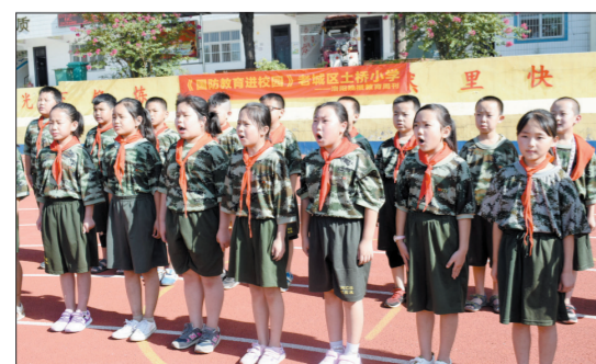
军歌嘹亮(老城区土桥小学)