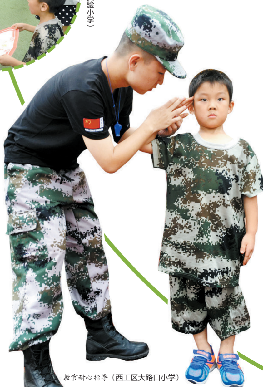
教官耐心指导(西工区大路口小学)