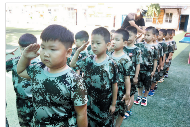
学习敬礼(西工区第三实验小学)

“国防教育进校园”主题活动,对新人小学的学生来讲意义非凡,军训期间学生们刻苦训练、合作无间、遵守纪律,这段经历将直接影响到孩子们今后的学习、生活。