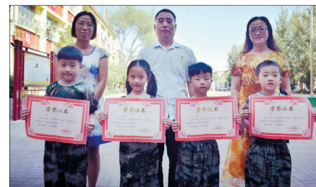
颁奖(西工区黎明小学)

活动期间,教官对孩子们进行了立正、稍息、向左转、向右转、敬礼等方面的训练,孩子们在训练中展现出坚强的毅力。在会操展示环节,站立、左右转体、敬礼、喊口号……每一项内容,学生们都一丝不苟,俨然变成了一个雄赳赳、气昂昂的“小战士”。精彩的展示,赢得了在场师生和家长们的热烈掌声。