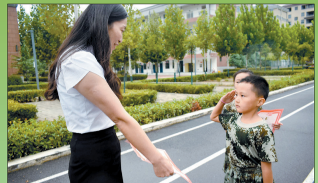
光荣颁奖(未来小学)