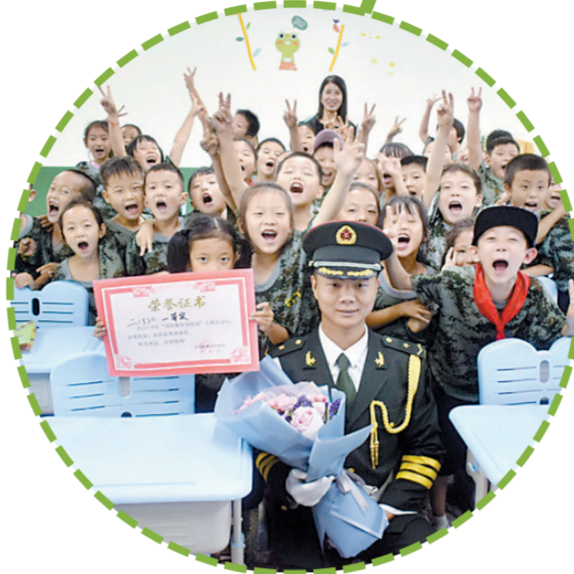
给教官献花(未来小学)