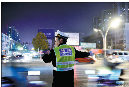
昨日晚高峰,执勤人员在王城大道丽春路路口疏导交通

记者从市交警支队获悉,因王城大道快速路建设需要,昨晚10点,王城大道中州路至丽春路段、九都路芳林路至涧东路段开始试围挡。同时,沿线相关区域的部分道路通行方式,较此前公布的方案有所调整,来看看记者为您整理的出行方案吧。