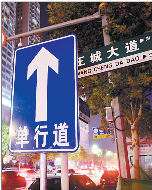
王城大道丽春路路口已设置丽春路方向单行标志