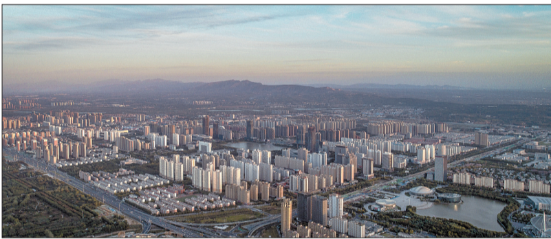
天边为嵩山山脉和万安山