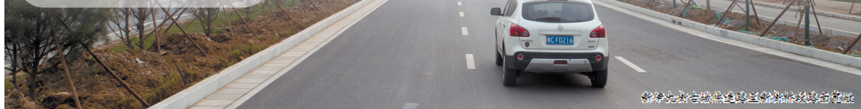
新伊大街古城快速路至新街桥段试通车

该负责人提醒,虽然该段道路已试通车,但仍有人员在路上施工,请市民通行时注意安全。