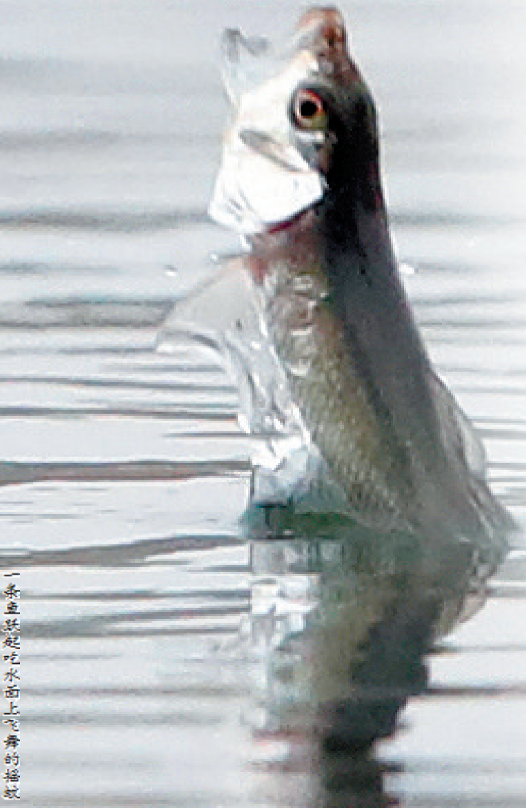
一条鱼跃起吃水面上飞舞的摇蚊