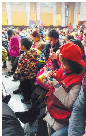
学习老师与小记者互动