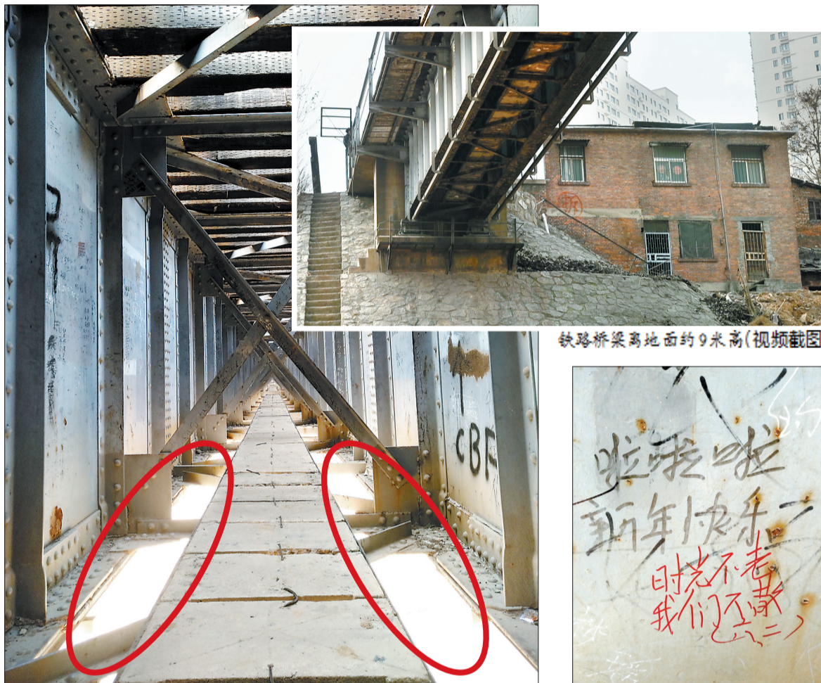
铁路桥梁内部有网传“表白墙”，水泥板两侧有不小空隙(红色圆圈处)，稍有不慎会掉下去