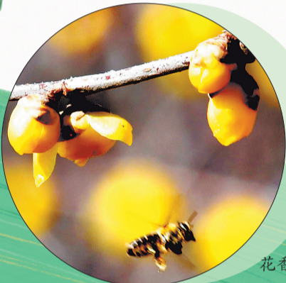
花香蜜蜂来