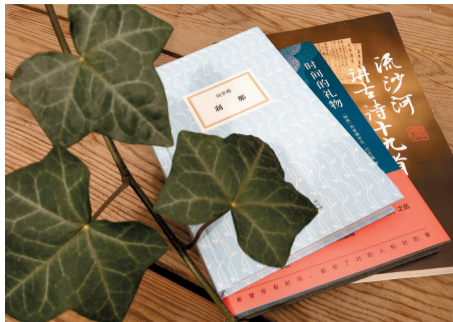
这三本书陪我走过一段旅程