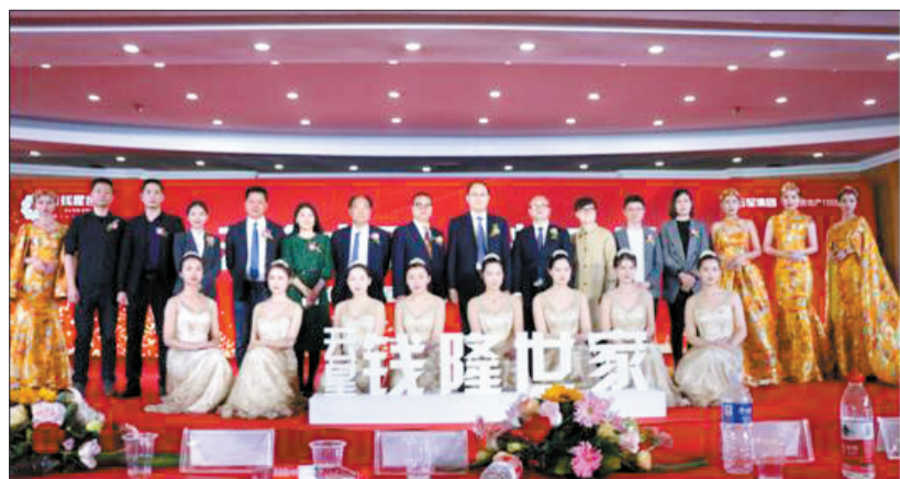
与会嘉宾合影(资料图片)

接下来,云星集团品牌部副总监、云星集团河南区域公司副总经理分别从项目选址、产品配套、户型设计、物业服务等方面,对云星·钱隆世家项目进行了深入介绍,全面展示了云星地产的工匠精神——从细节出发,以近乎严苛的标准,精确到业主生活的每一个场景,只为提高业主舒适体验,打造偃师人居“星”高地。(林林)