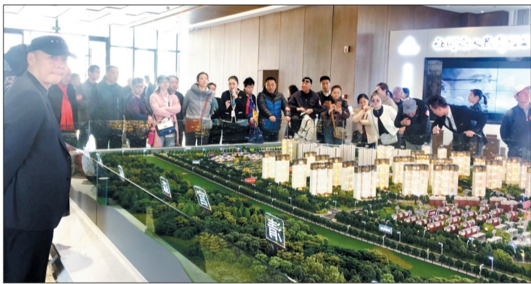
听置业顾问介绍项目信息(资料图片)

3月,由洛阳日报报业集团主办,洛阳日报、洛阳晚报、洛阳网承办的“读城:无边界·有力量——洛阳大板块的时代肖像”(简称“读城”)大型年度活动引起市民的强烈关注。众多读者通过上述主流媒体对洛北板块交通、环境、配套的详细解读及洛北片区明星楼盘推介,深入了解到该片区的发展潜力及未来居住舒适度。