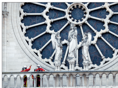
大火已全部扑灭