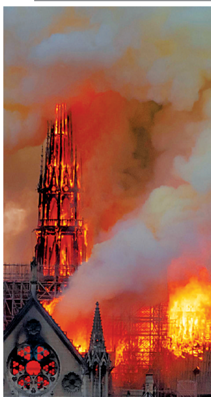
巴黎圣母院燃起大火

在《巴黎圣母院》里，雨果在炼金术士的炼金房风箱上写下一句铭文：“Spira, Spera。”它的意思是：只要还有气息，就还有希望。巴黎圣母院虽遭此厄难，但我们相信，“只要还有气息，就还有希望”。