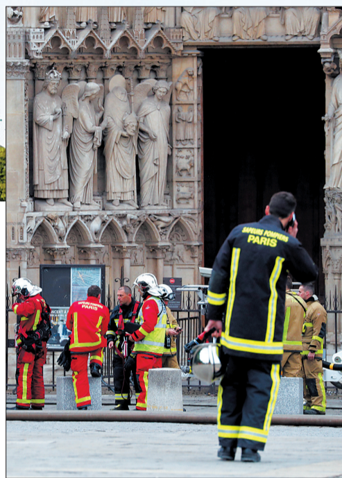
消防人员在巴黎圣母院工作

修复计划于1844年开始，工程持续了23年，修缮了尖顶和圣器堂。今日，巴黎圣母院依然是法国哥特式建筑的旷世杰作，并几乎保持了最初的风貌。巴黎圣母院也展现了哥特式教堂的发展史。