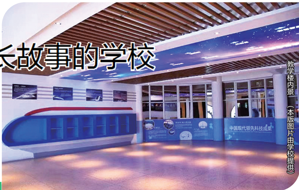
教学楼内景

位于北盟路141号的瀍河一实小,其占地18000平方米的校园给人的感觉就是三个字:高、大、上。该校秉承“能动育人、养正雅趣”的办学理念,致力于让每个学生都能够拥有精彩成长故事的人生,激发学生的潜力和激情,让每个学生都闪耀优秀的光芒。