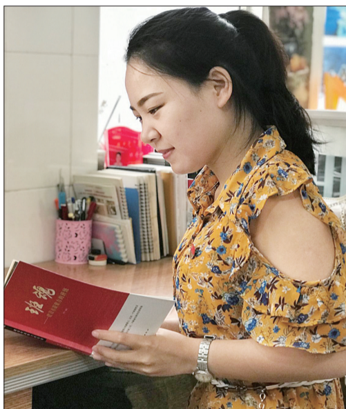
为挤出时间照顾学生,她吃住在学校

这群师生的“最后一课”在网上传开并引发共鸣,不少人看到这段师生情表示眼眶发热,称赞他们“聚是一团火,散是满天星”。