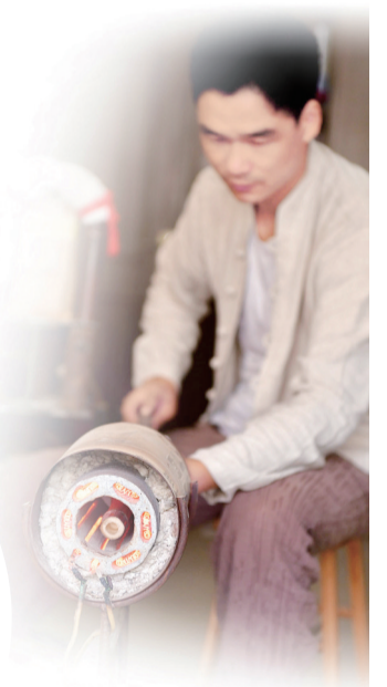
用专业的工具烤竹