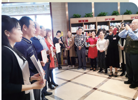
捐10本书及以上就能获得《捐赠证书》