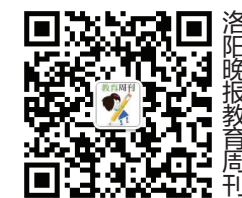
洛阳晚报教育周刊