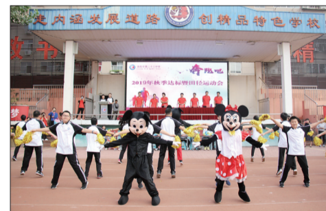
班级风采展示活动