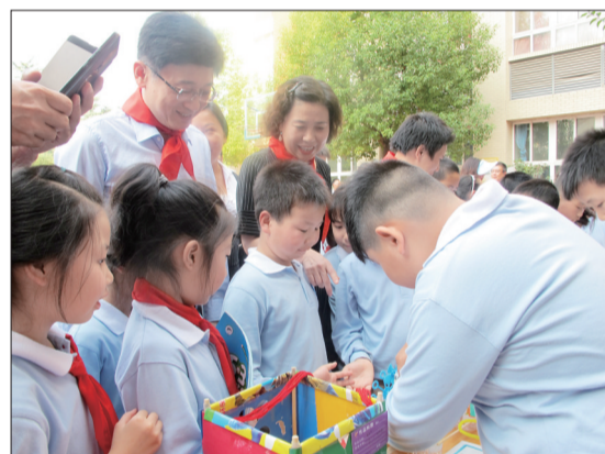
科技小作品展前人气爆棚

快来看,比赛已经开始了!小选手们站成一排,手指来回拨动着套在一起的金属圆环,看谁先把它们全部解开;四级联动装置上,沙漏、多米诺骨牌等机关设计巧妙,让人大开眼界;机械蠕虫赛场上,竞争激烈,一条条小蠕虫爬行向前,每一步都牵动着选手和观众的心;最安静的要数牙签建塔现场了,学生和家长屏气凝神、配合默契,一座座由牙签和胡萝卜块搭成的小塔层层升高……赛场上气氛热烈,科技小作品和自然观察笔记展前更是人头攒动,惊呼不断。