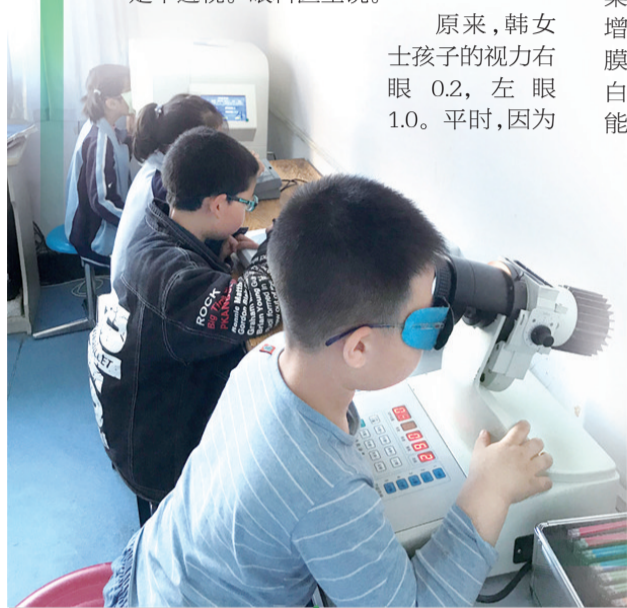
及时进行视觉训练,让孩子视力更健康(资料图片)