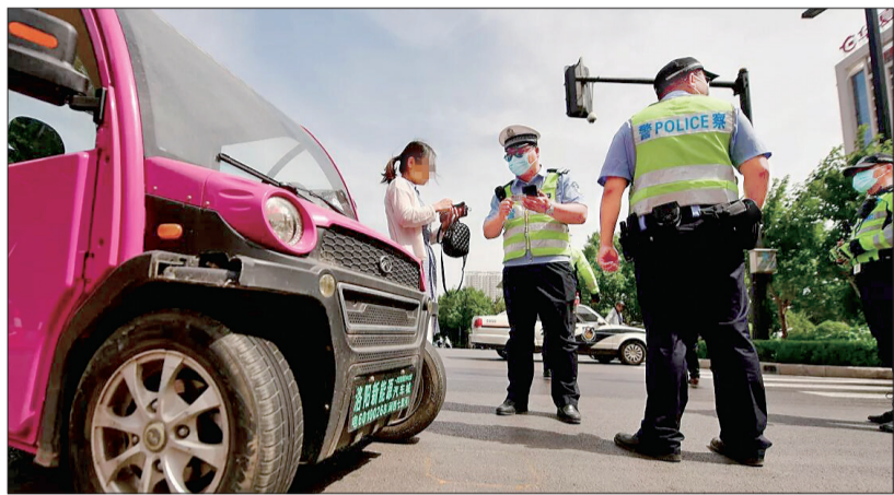
交警查处低速四轮车交通违法行为