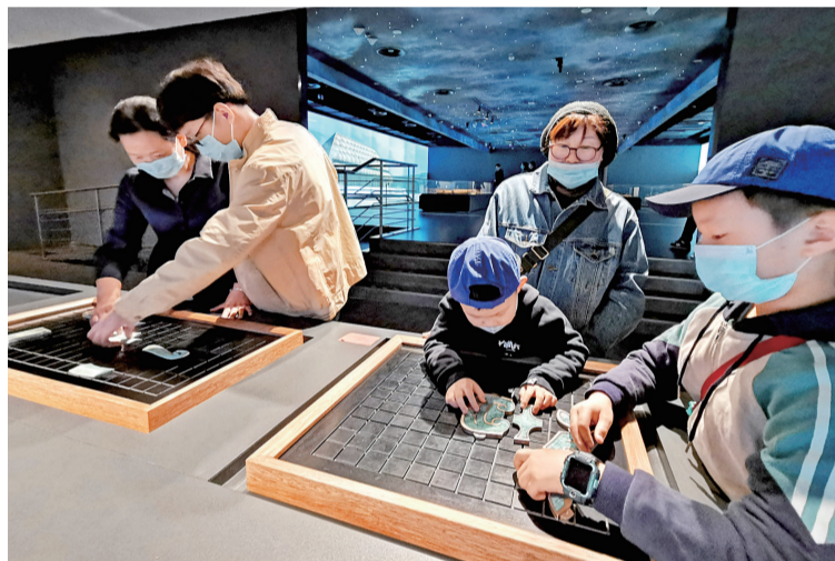
互动体验平台,吸引游客驻足