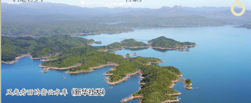
风光秀丽的密云水库