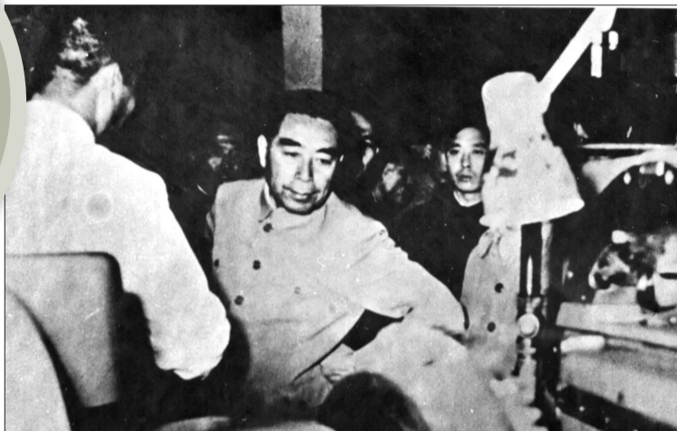
↑周总理视察洛矿一金工车间

1960年9月,一座集防洪、灌溉、供水、发电、养殖等多功能于一体的大型水利枢纽工程——密云水库竣工。这座水库最大库容43.75亿立方米,最大水面面积188平方公里,实现了“一年拦洪、两年建成”的辉煌成就。