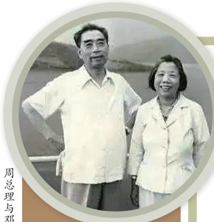
周总理与邓颖超在密云水库合影