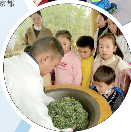
孩子们观看炒制迷迭香