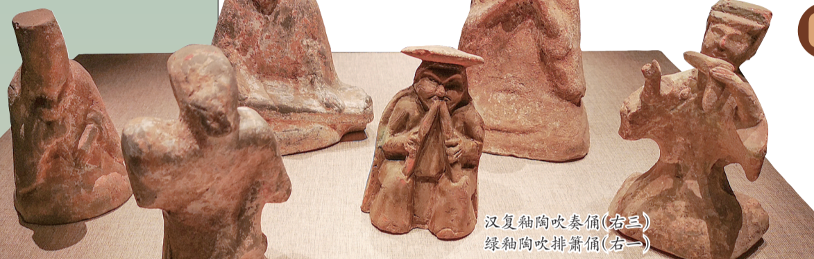
汉复釉陶吹奏俑(右三) 绿釉陶吹排箫俑(右一)

讲解员介绍,博山炉的出现,和西汉时期道教思想盛行有关。香料在燃烧时,青烟从镂空的山形浮雕中散出,仙气缭绕,仿佛置身仙境。博山炉的流行,以古时人们追求长生不死或死后成仙的思想为背景,体现了当时社会对道教的普遍推崇。