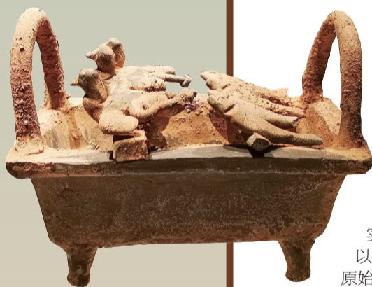
汉代复釉烧烤炉