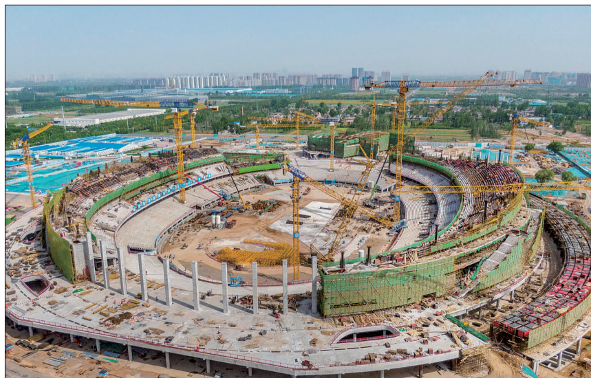
俯瞰项目施工现场