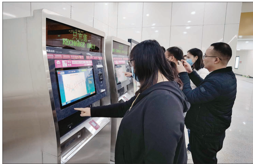
乘客在自动售票机上购票

市轨道交通集团相关负责人介绍,5月10日前,地铁1号线仍将执行牡丹文化节运行图,每日营运时间为6点半至22点半,高峰期行车间隔7分钟,平峰期行车间隔10分钟。同时,五一假期,地铁1号线将进一步加密运行,为市民提供更加快捷的乘车服务。