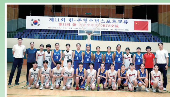
市二女篮受邀到韩国交流