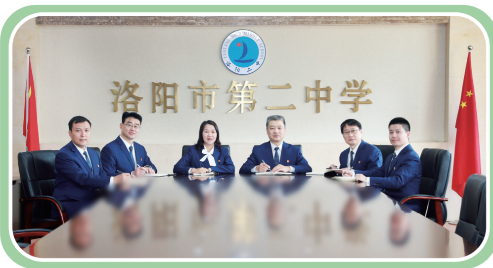
学校领导班子成员

是真正的良性循环。2020年12月,新一届领导班子成立后,学校提出了新的三年规划,明确了创建全国文明城市、创建省市一流优质高中的奋斗目标和美好愿景。