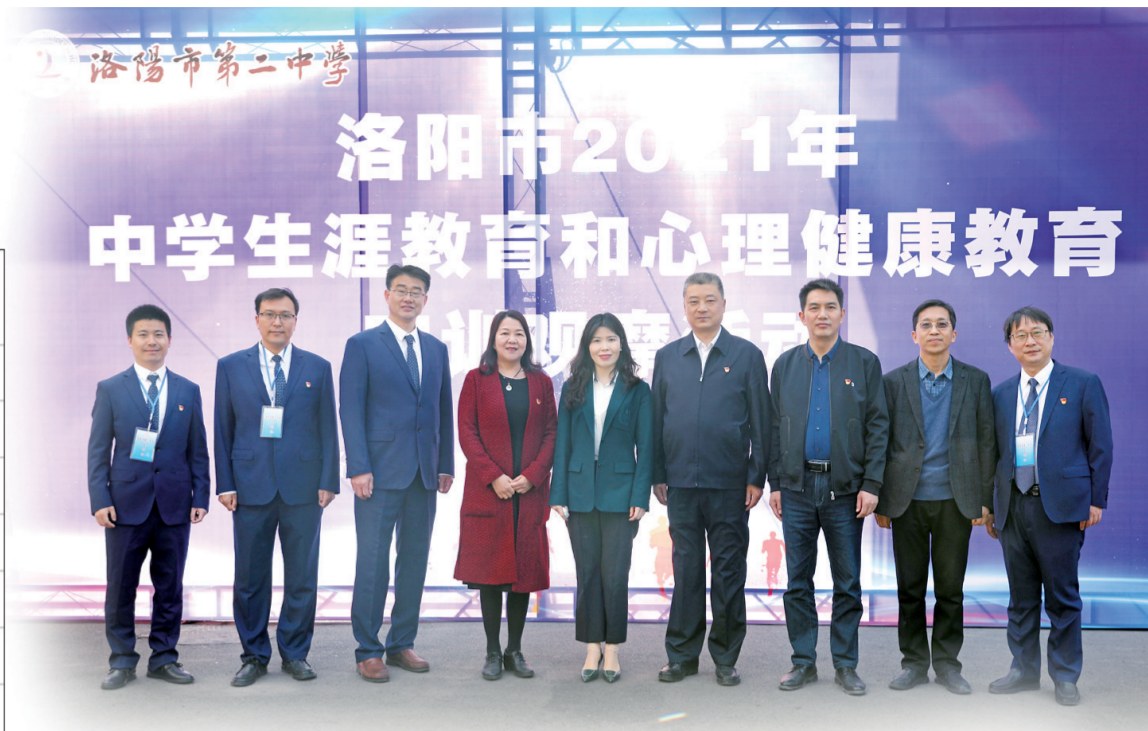
洛阳市2021年中学生涯教育和心理健康教育实训观摩活动