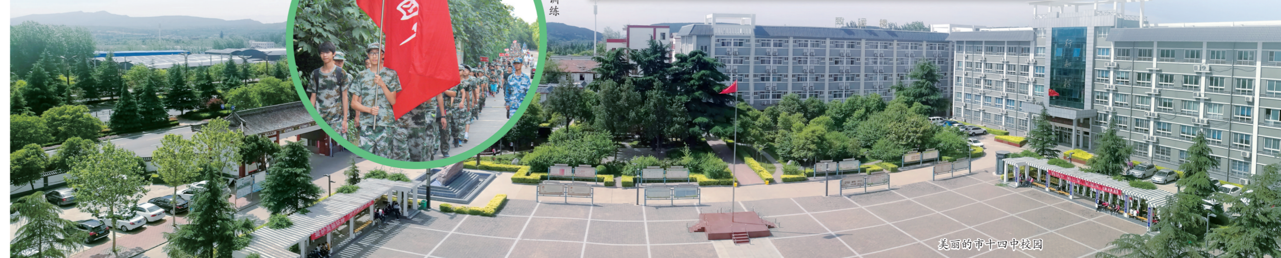
美丽的市十四中校园