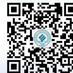
市十四中微信二维码