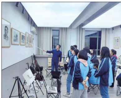
专业教师精心指导