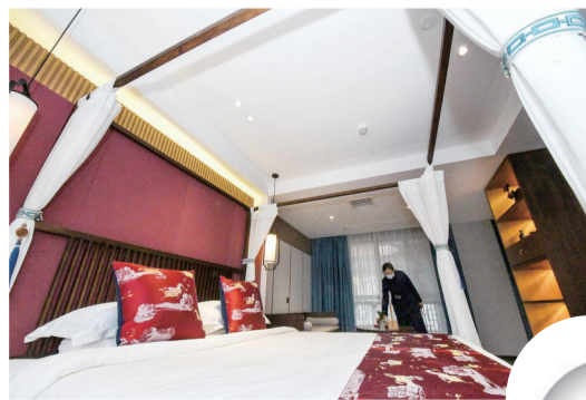
客房充满古典气息