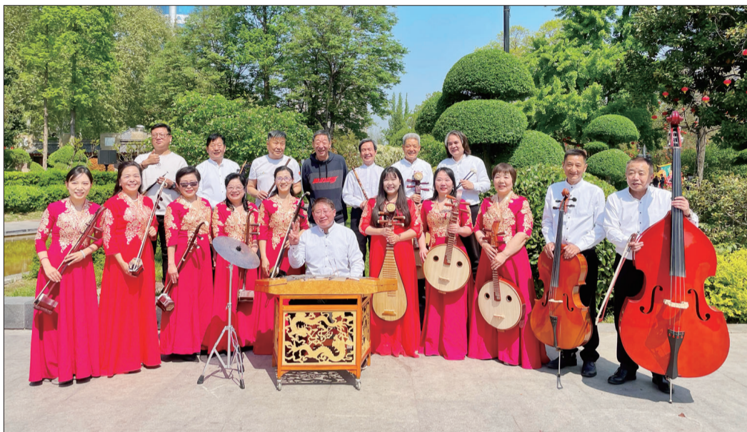
演出结束后,乐队成员合影