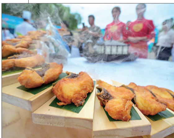
参赛厨师做的美味