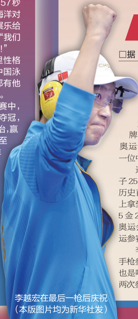
李越宏在最后一枪后庆祝

李越宏是中国射击队步枪和手枪参赛阵容中年龄最大的选手,也是唯一一名“80后”。此前他曾两次参加奥运会,夺得2枚铜牌。