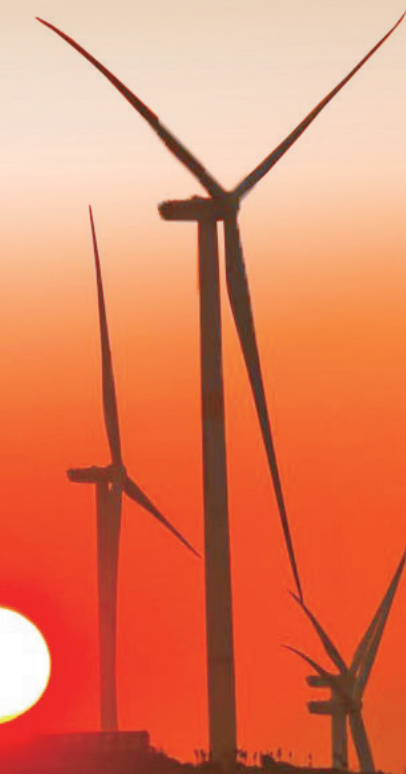
霞光映照首阳山