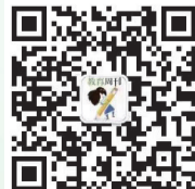
洛阳晚报教育周刊