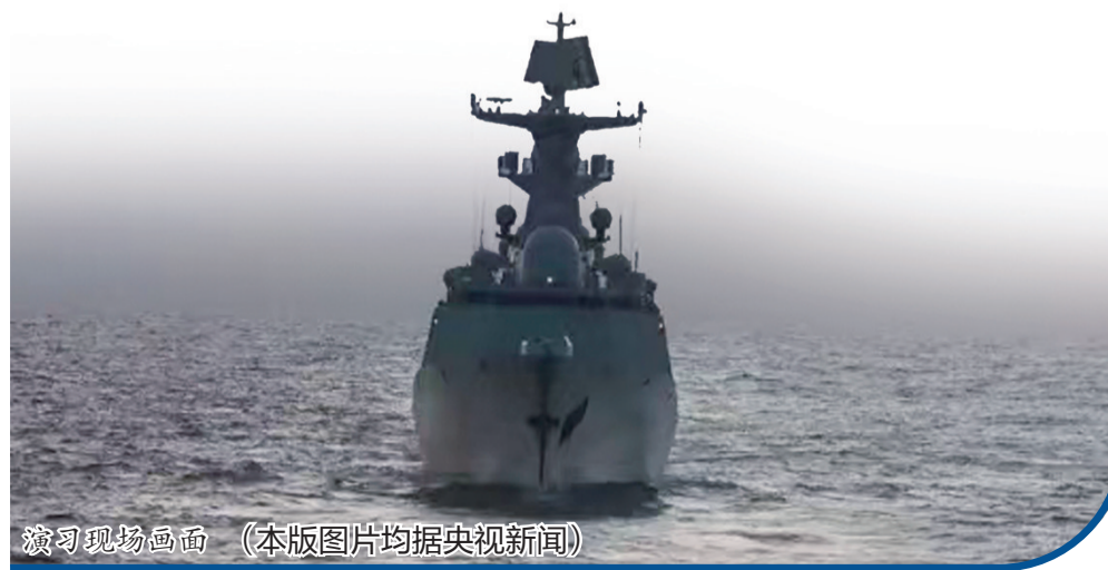
演习现场画面 (本版图片均据央视新闻)

●“破线”马祖,靠大陆一侧外岛全控。这是我海警第一次进入马祖岛所谓“限制水域”,彻底撕开台当局所谓“划线”。这意味着海警通过此次行动完成了对台湾地区靠近大陆一侧的所有外岛的执法管控,并且将来或对马祖岛实施常态化执法巡查。