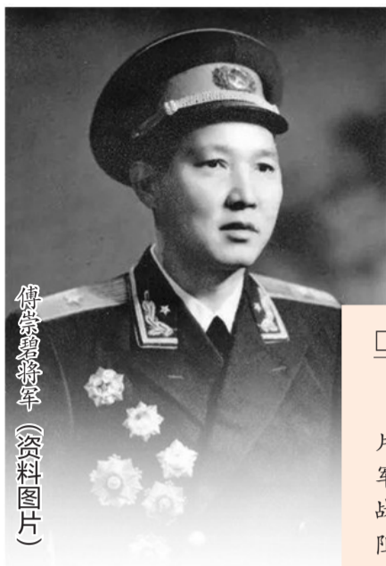
傅崇碧将军 (资料图片)