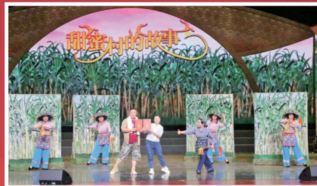
陆川客家哩戏《甜蜜村的故事》剧照