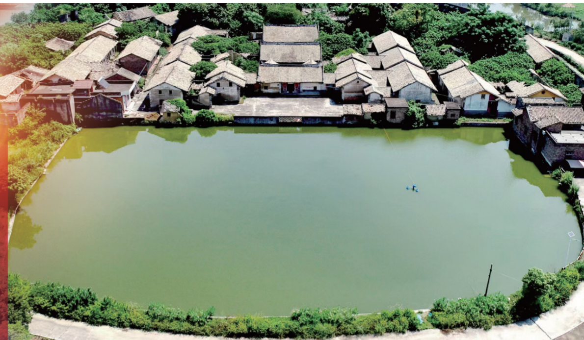
位于玉州区南江街道岭塘村的砾砂坳客家围屋